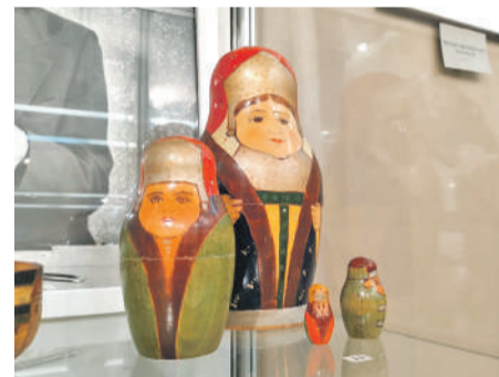
Набор матрёшек «Боярыни» (1910-е гг.)