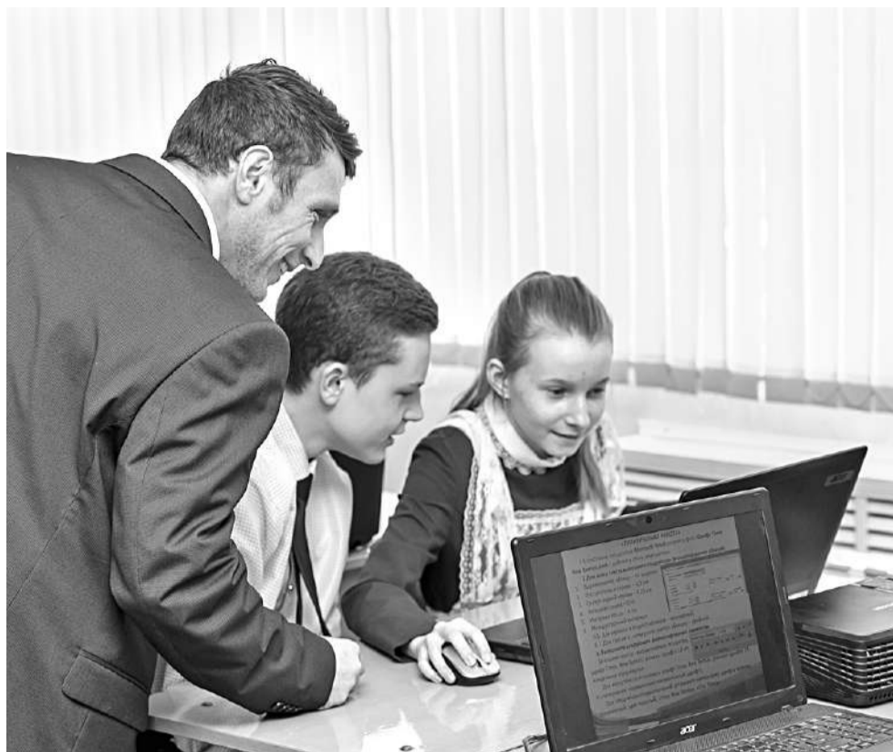
Ребята выполняют практическое задание на компьютере

Учитель раздаёт ребятам карточки с вопросами: «Чему я научился за эту неделю?», «Какие вопросы для меня остались неясными?», «Какие вопросы